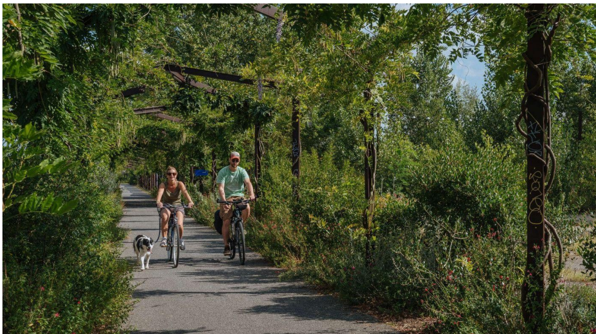
Το ποδηλατικό μονοπάτι Roger Lapébie, Μπορντό, πηγή: https://www.bordeaux-tourisme.com/loisirs-incontournables/bordeaux-velo-coups-coeur-bordeaux-bike-experience