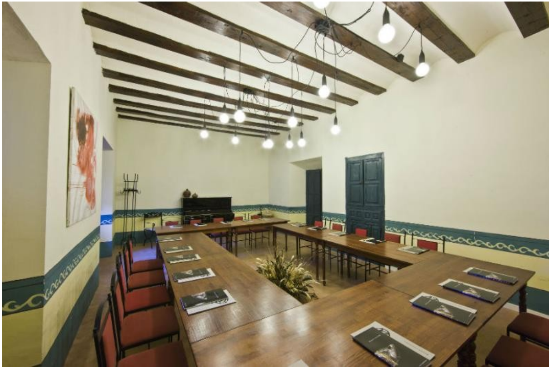
FSMA – Αίθουσα συνεδριάσεων