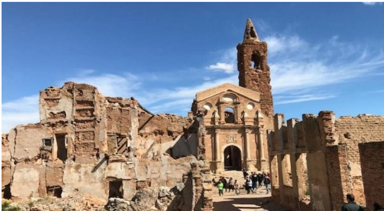
Το χωριό Belchite