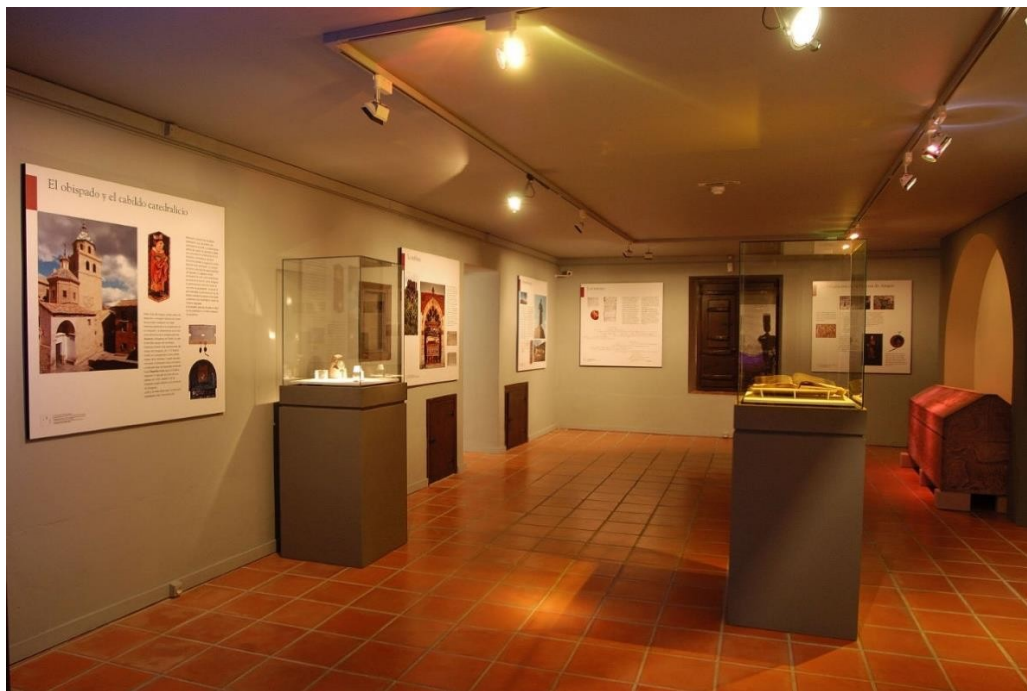
FSMA – Μουσείο Albarracín