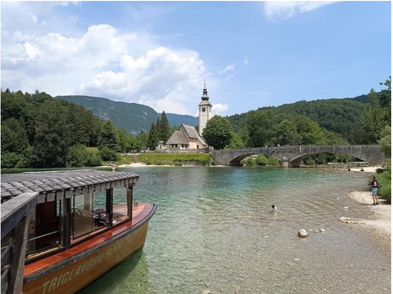
Η λίμνη Bohinj, Εκκλησία του ST John on Bohinj, Σλοβενία