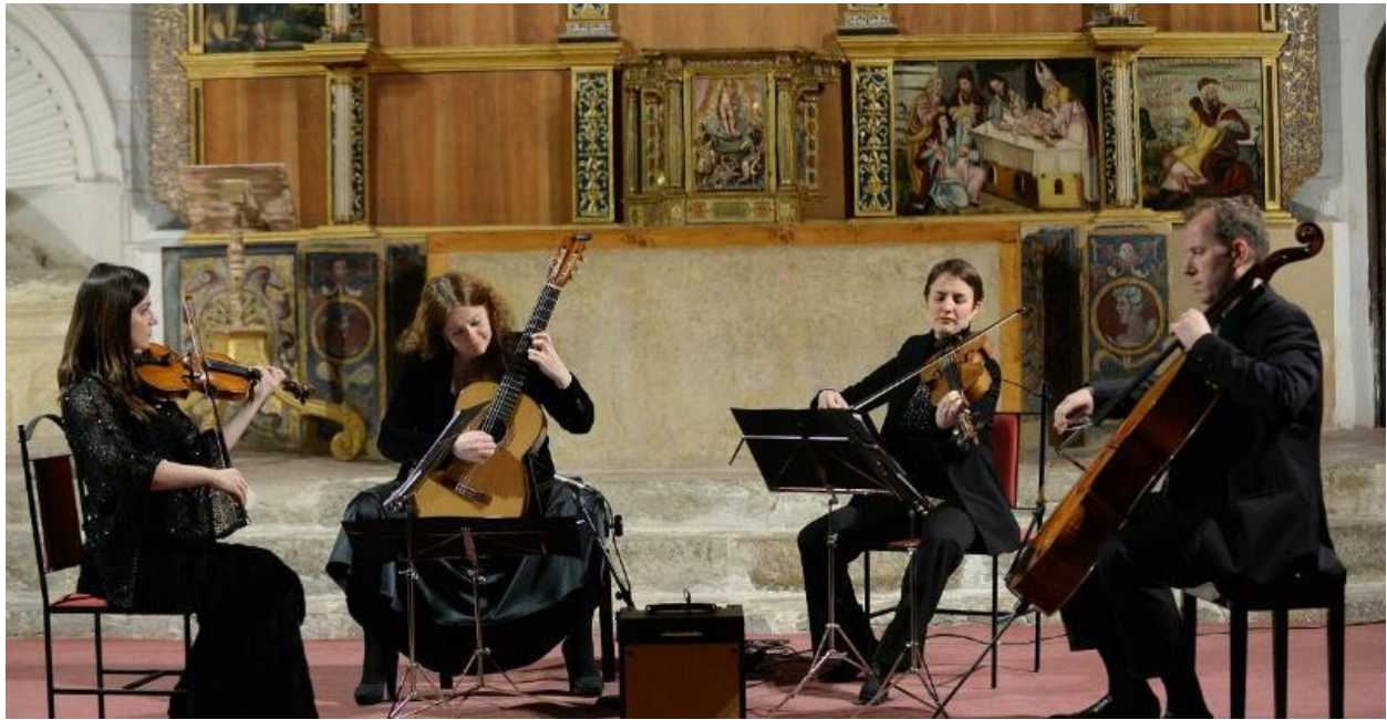
Μουσική συναυλία (Καθεδρικός ναός Albarracín)