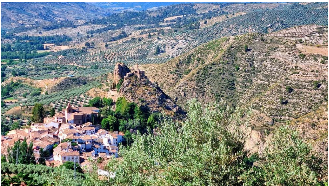
Το παράδειγμα του τοπίου στο Altiplano de Granada, Δήμος του Castril