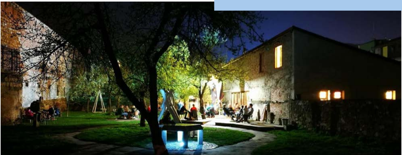
Záhřada ( https://www.zahradacnk.sk/zahrada )