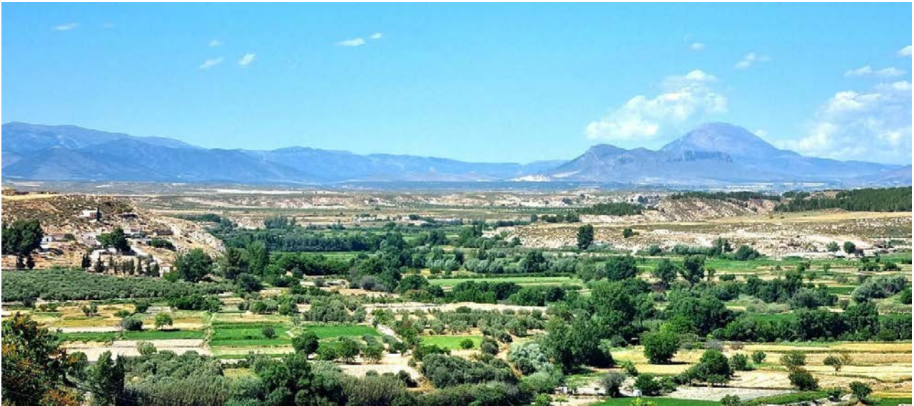
Το παράδειγμα του τοπίου στο Altiplano de Granada, δήμος Benamaurel