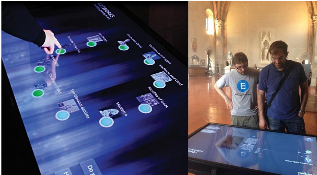
Η επιτραπέζια συσκευή στο Donatello Hall δείχνει στους επισκέπτες πληροφορίες- εικόνα από: https://www.micc.unifi.it/projects/mnemosyne/#