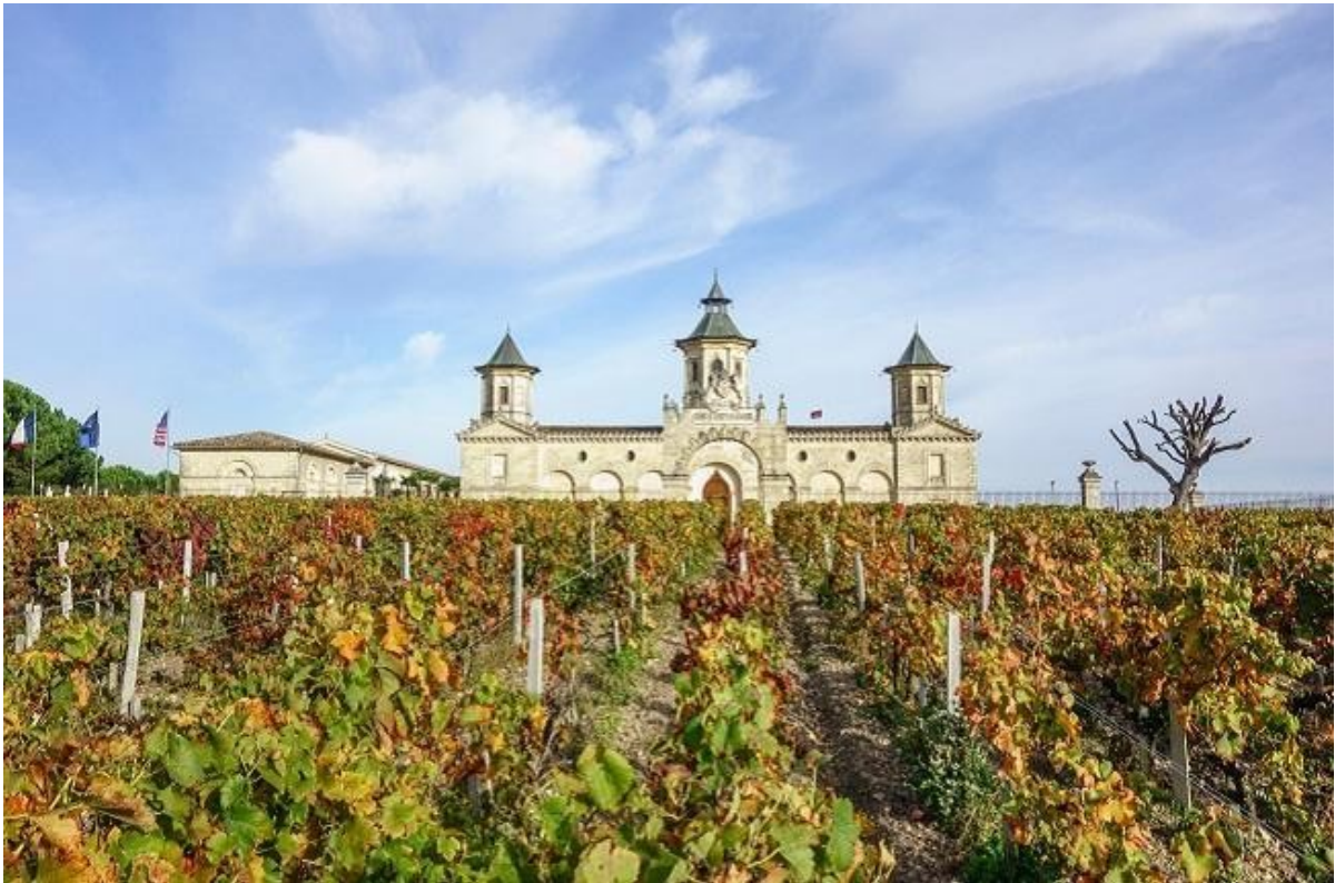
Αμπέλι στο Μπορντό, Γαλλία